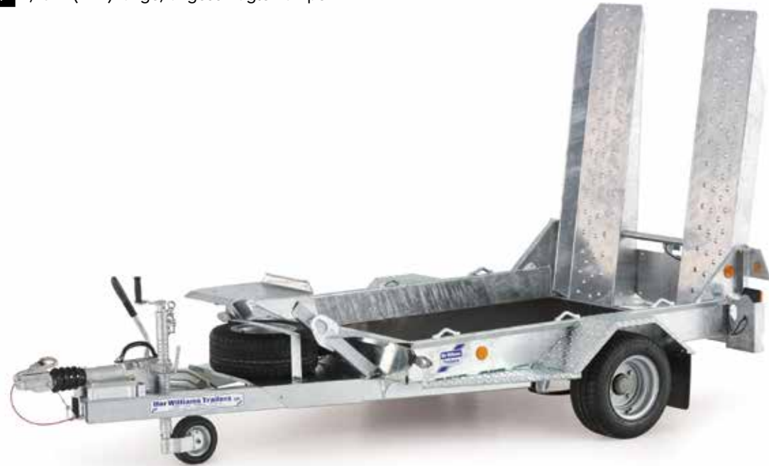
GH94 mit 195/55R10C Reifen und 1,20 m (3'9") Rampe mit Gitternetzfüllung und optionalen 12/24 V LED Beleuchtung

Eine LED 12/24 V Beleuchtung ist für alle GH Modelle optional erhältlich. Ein echter Vorteil für den Miet-Fuhrpark. Die LED Beleuchtung benötigt sehr wenig Strom, dennoch kommt es gelegentlich zu Problemen, in ebenso mit LED ausgestatteten Zugfahrzeugen. Hier kann es vorkommen, dass Warnlampen im Armaturenbrett kontinuierlich aufleuchten und fehlerhafte Informationen gegeben werden. Wenn solche Probleme auftreten, so kontaktieren Sie bitte Ihre Werkstatt, oder vergewissern Sie sich vor Kauf bei Ihrem Zugfahrzeughersteller, dass es nicht zu unerwünschten Komplikationen kommt.