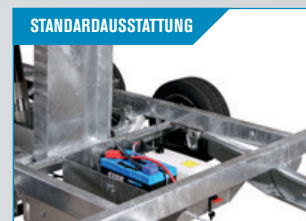
STANDARD-AUSSTATTUNG El-hydraulischer Kipp, kplt. mit Batterie und eingebautem Ladegerät.