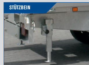
STÜTZBEIN Kräftiges Modell - montiert unter der Ladefläche.