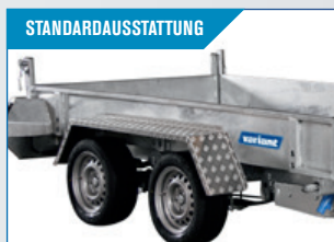
STANDARD-AUSSTATTUNG Aluminiumkotflügel. Solide und robust. Vollendet das schöne Äußere.