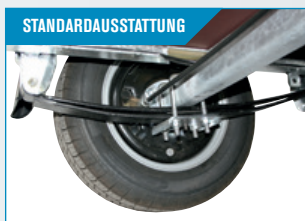
STANDARD-AUSSTATTUNG Parabelfedern sichern hohen Komfort und Robustheit.

Siehe Universalausstattung auf Seite 38-39. Unten abgebildete Teile sind Extra-Zubehör.