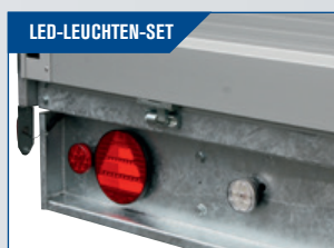
LED-LEUCHTEN-SET Gutes und starkes LED-Licht. Gute Sicherheit im Dunkeln.