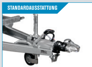
STANDARD-AUSSTATTUNG Robustes Stützrad. Bei 3515 MT mit Rippen. Kugelkupplung mit Schloss bei 3515 MT.