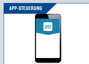
APP-STEUERUNG Für die Steuerung des Kippens. Geeignet für mehrere Benutzer.