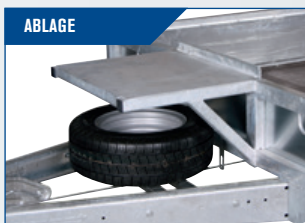
ABLAGE Praktische vordere Schaufelablage. Ein Ersatzrad kann zugekauft werden.