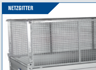
NETZGITTER Robuste, feuerverzinkte Qualität. Höhe 80 cm.