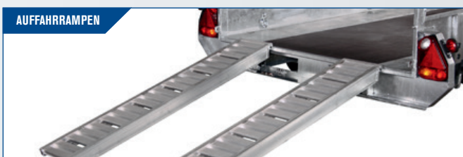
AUFFAHRAMPEN Für den Gebrauch von Maschinen bei der Auffahrt. Die speziell entwickelten Aluminium-Auffahrampen haben eine besonders hohe Qualitätsstärke und sorgen für eine gleichmäßige Auffahrt zum Anhänger. Während einer Fahrt sind die Rampen in einem integrierten Bohlschacht aufbewahrt.