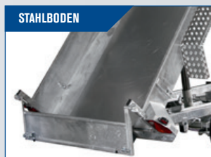
STAHLBODEN Glatt, für leichtes Abladen von Kies, etc. - beschützt den Furnierboden.