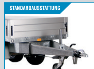
STANDARDAUSSTATTUNG Stützrad mit Kipp, für leichtes Rangieren.