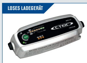
LOSES LADEGERÄT Zum Aufladen der Batterie.