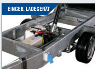
EINGEB. LADEGERÄT Eingebaut mit Konverterkabel zum direkten Anschluss an eine Steckdose. Wird empfohlen.