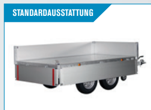
STANDARDAUSSTATTUNG Klappbare und abnehmbare Seiten. Eckpfosten können ohne Werkzeug entfernt werden.