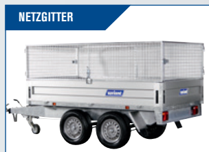
NETZGITTER Robuste, feuerverzinkte Qualität mit Öffnung vorne und hinten. Höhe 60 cm.