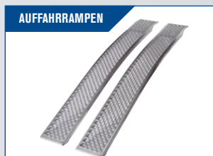
AUFAHRRAMPEN Empfohlenes Rampenset finden Sie unter dem Anhängermodell. Komplett Übersicht - Seite 37.