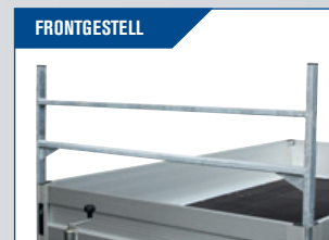
FRONTGESTELL Feuerverzinktes Stativ für Befestigung von Gütern. Montiert in den Ecken. Höhe 70 cm.