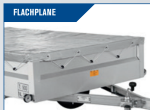
FLACHPLANE Schützt vor Wind und Wetter Ihre Güter und den Anhänger. Wir empfehlen dazu einen Planenbügel.