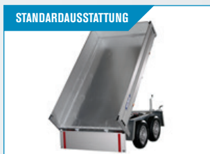
STANDARDAUSSTATTUNG Verzinkter Stahlboden mit 6x kräftigen Verzurrösen.

Gut für den Einsatz, wo der Platz eng ist.