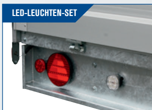
LED-LEUCHTEN-SET Gutes und starkes LED-Licht. Gute Sicherheit im Dunkeln.