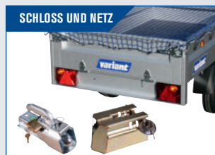
SCHLOSS UND NETZ Viele Modelle. Sehen Sie mehr über die große Auswahl auf Seite 38-39.