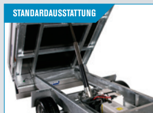
STANDARDAUSSTATTUNG El-hydraulischer Kipp, sowie Batterie und Fernbedienung sind bei allen Modellen Standard.