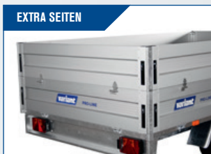
EXTRA SEITEN Erhöhen das Raumvolumen vom Anhänger. Klappbar und abnehmbar. Höhe 35 cm.

Siehe Universalausstattung auf Seite 38-39. Unten abgebildete Teile sind Extra-Zubehör.