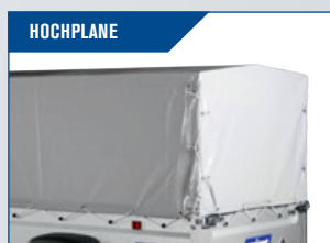
HOCHPLANE Kräftige Qualität mit Öffnung auf der Rückseite. Innenhöhe 145 cm.